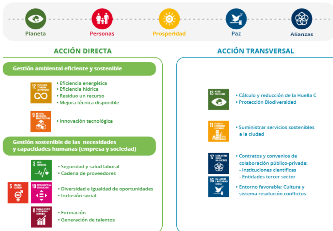
Figura 2. Objetivos y prioridades de FCC Medio Ambiente para cumplir con los ODS de la Agenda 2030.

Con todo ello, se han definido 4 ejes que marcarán la actuación de FCC Medio Ambiente Iberia en materia de gestión sostenible: MEDIO AMBIENTE , SOCIAL , EXCELENCIA y GOBERNANZA